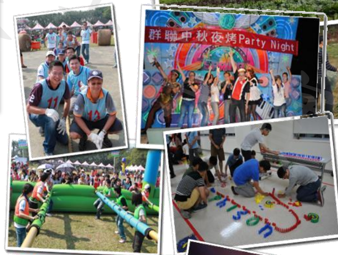
各種活動 & 家庭日 & 尾牙